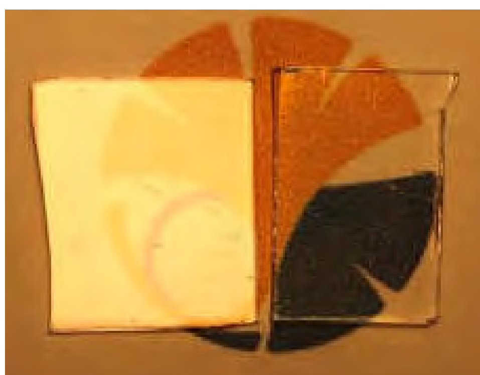
Reflection image of glass before (left) and after (right) surface treatment