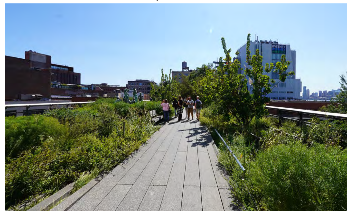
C. The High Line Park