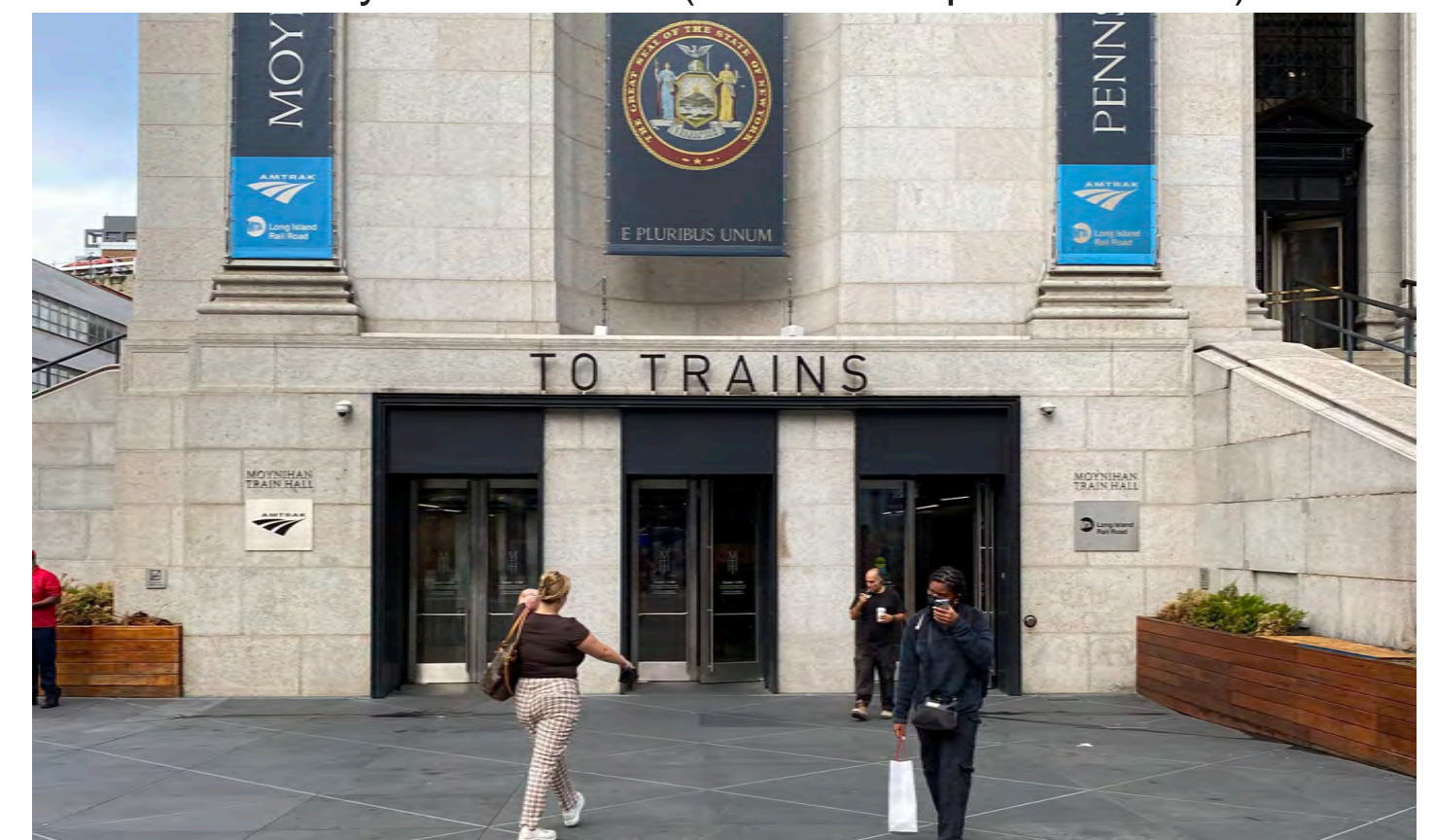
D. Entrance of Moynihan Train Hall

人口集中による都市の高密度化は、環境問題や地域格差を助長し、様々な都市問題を誘起している。このように全世界で都市の問題が深刻化している今、コンパクトシティなどの都市モデルが再考され、公共交通サービスを積極的に活用した持続可能な都市開発モデルが注目されている。