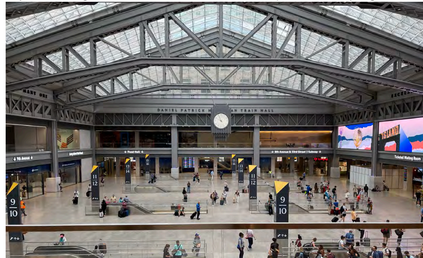
A. Moynihan Train Hall