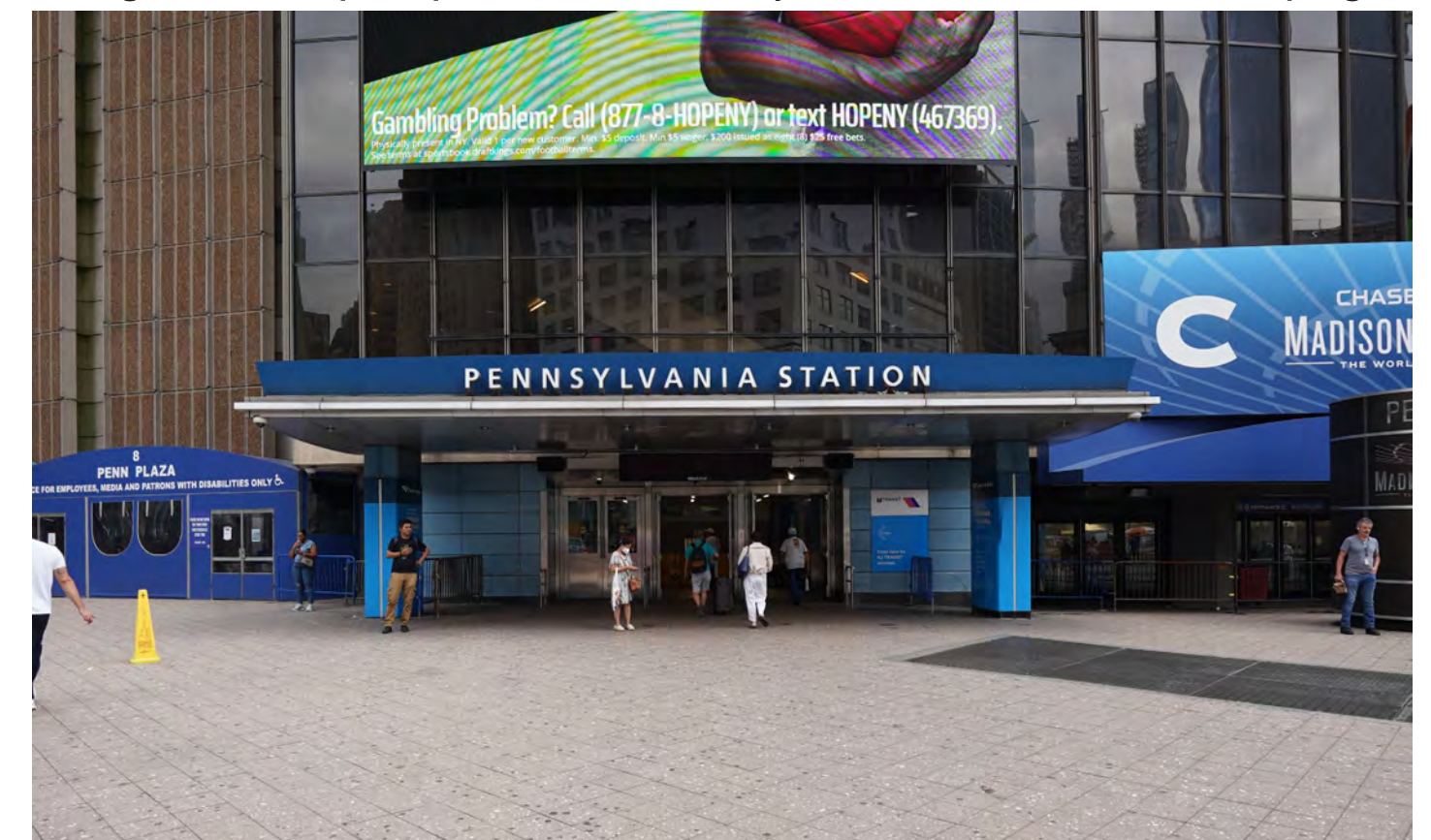
B. Pennsylvania Station (Madison Square Garden)