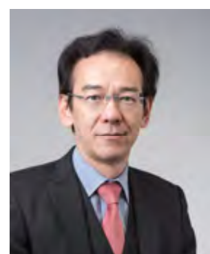
吉川 暢宏 教授