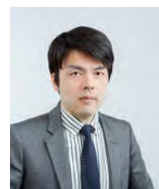
溝口 照康 教授*