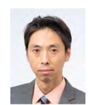
長谷川 洋介 教授