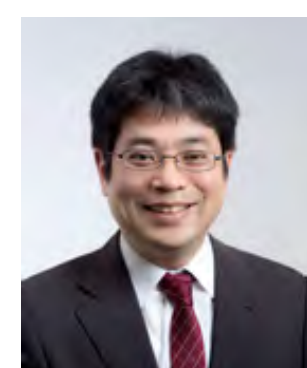
大岡 龍三 教授*