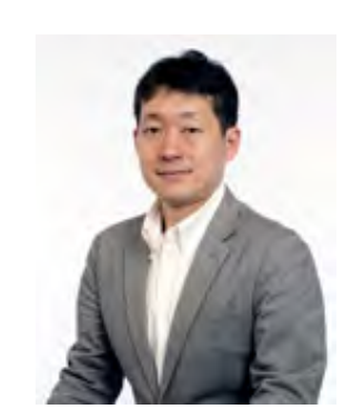
井上 純哉 教授*