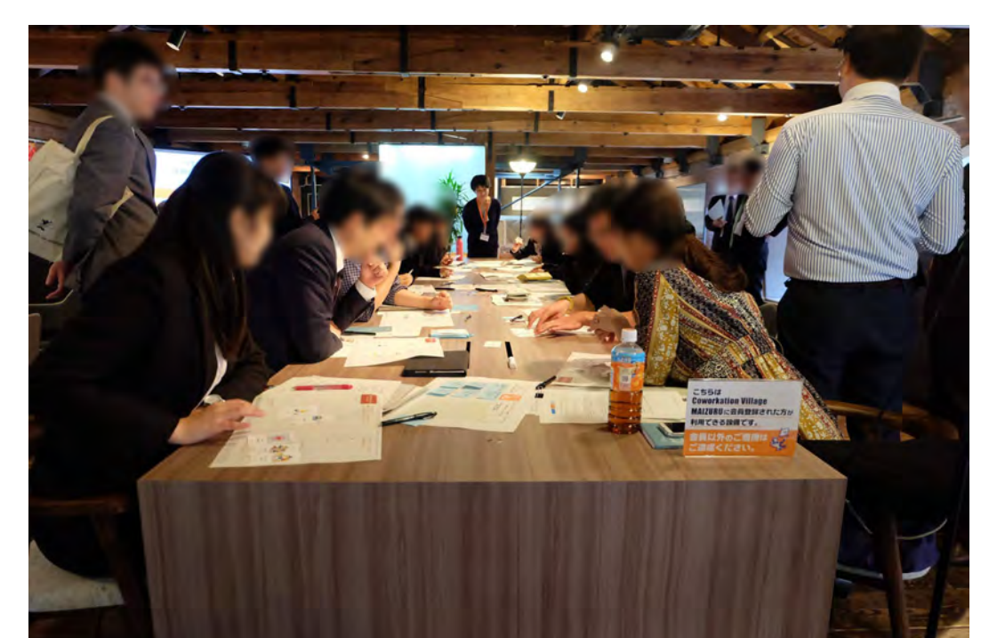
生産技術研究所の地域連携活動で使用したツールを活用した未然課題抽出WSの開催