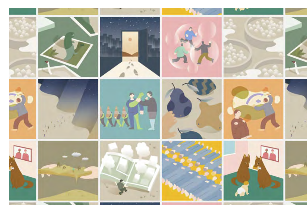
スペキュラティブデザインを応用した全国の高校生を対象としたオンラインWSの開催