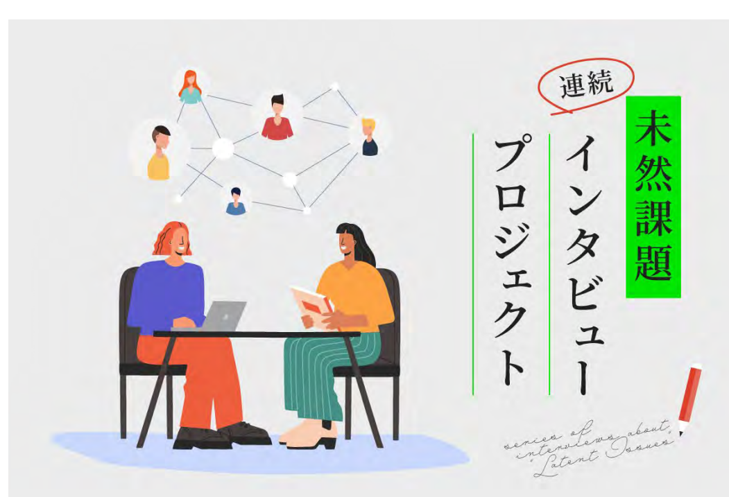
「未然課題」を共通テーマとした所内研究者への連続インタビューの実施