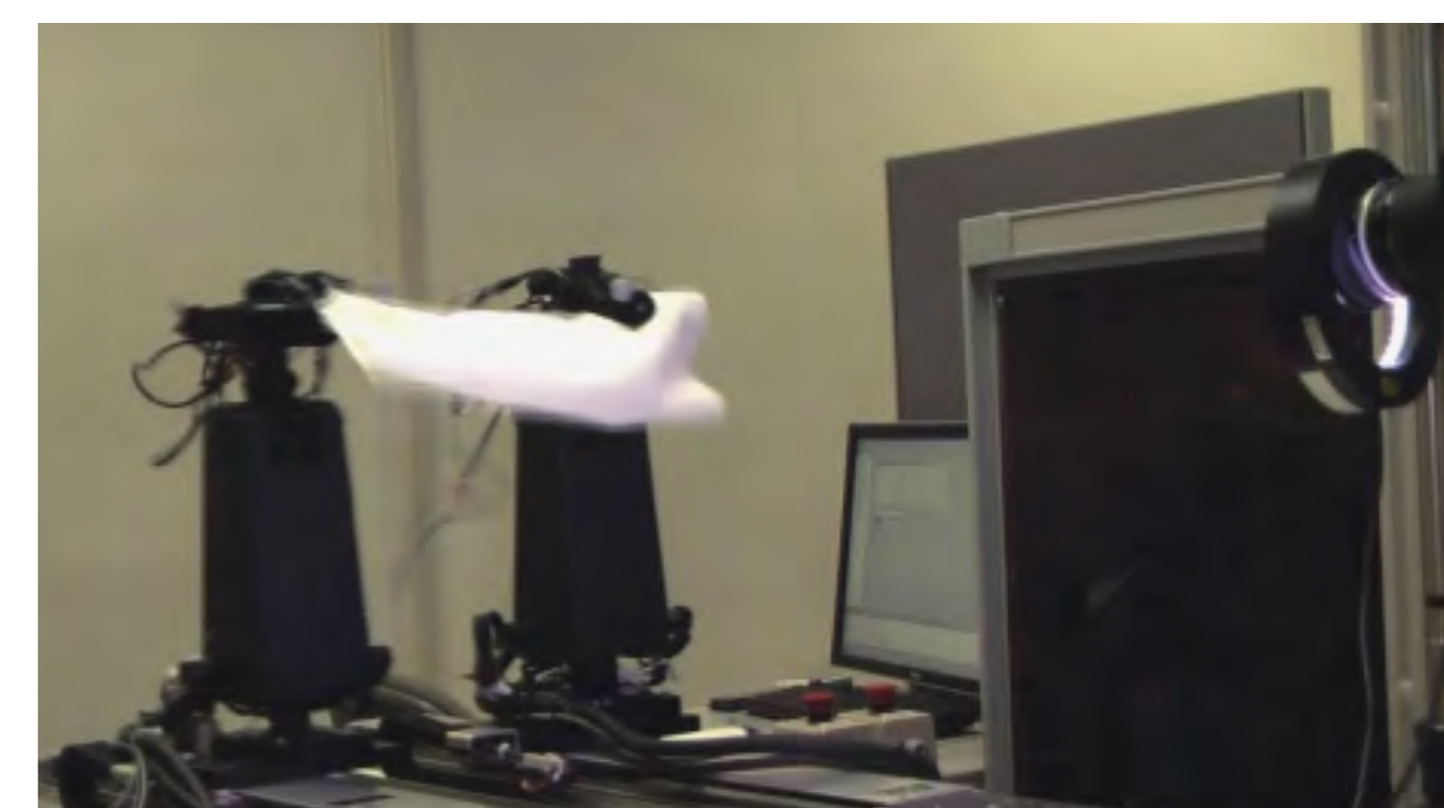
布の動的折りたたみ操作

従来困難とされてきたロボットによる柔軟物操作に着目し, 高速ロボットを用いた柔軟物の高速操りの実現を目指しています. ロボットの高速運動性を利用することにより, ロボットの制御則や軌道生成を簡易化することに成功しています. 本成果と高速視覚制御を統合し, 柔軟紐の片手結び操作や布の動的折りたたみ操作を実現しています.