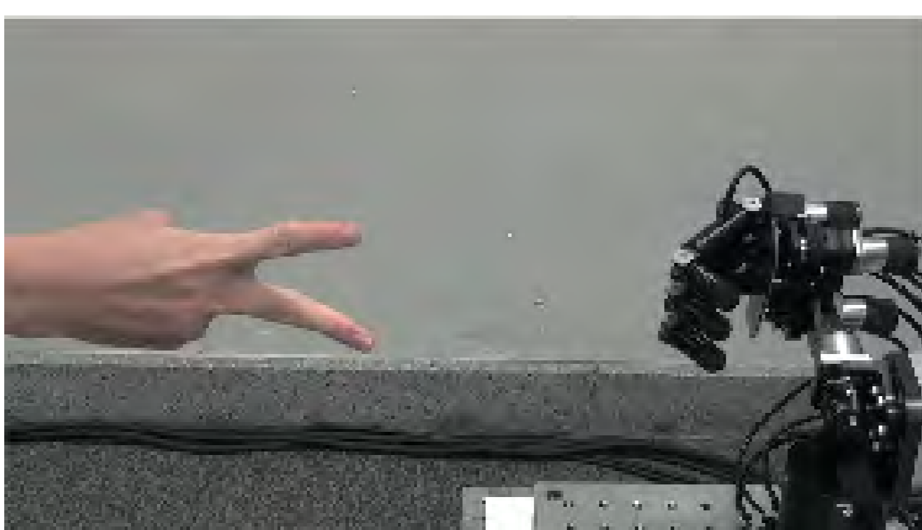
勝率100%じゃんけんロボット