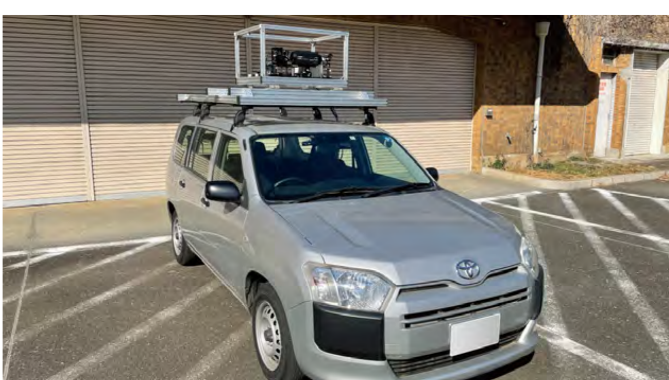
車載高速ビジョンシステム