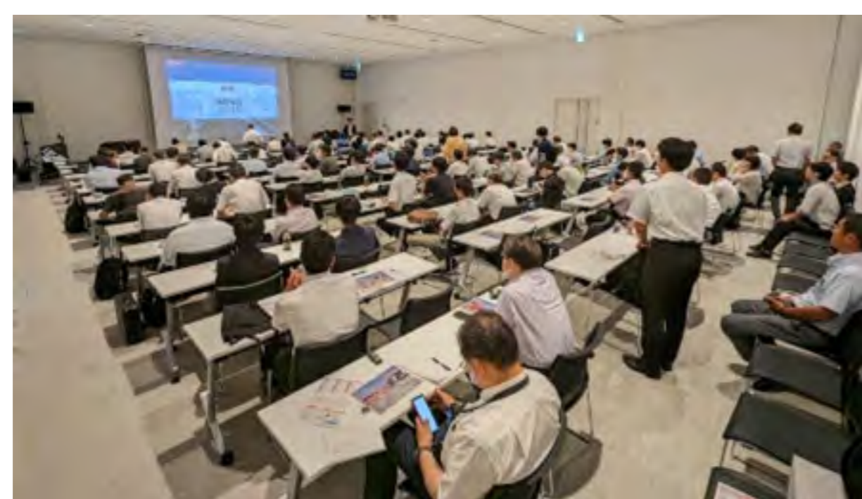
【ITSセミナーin とちぎ (2023年8月)】