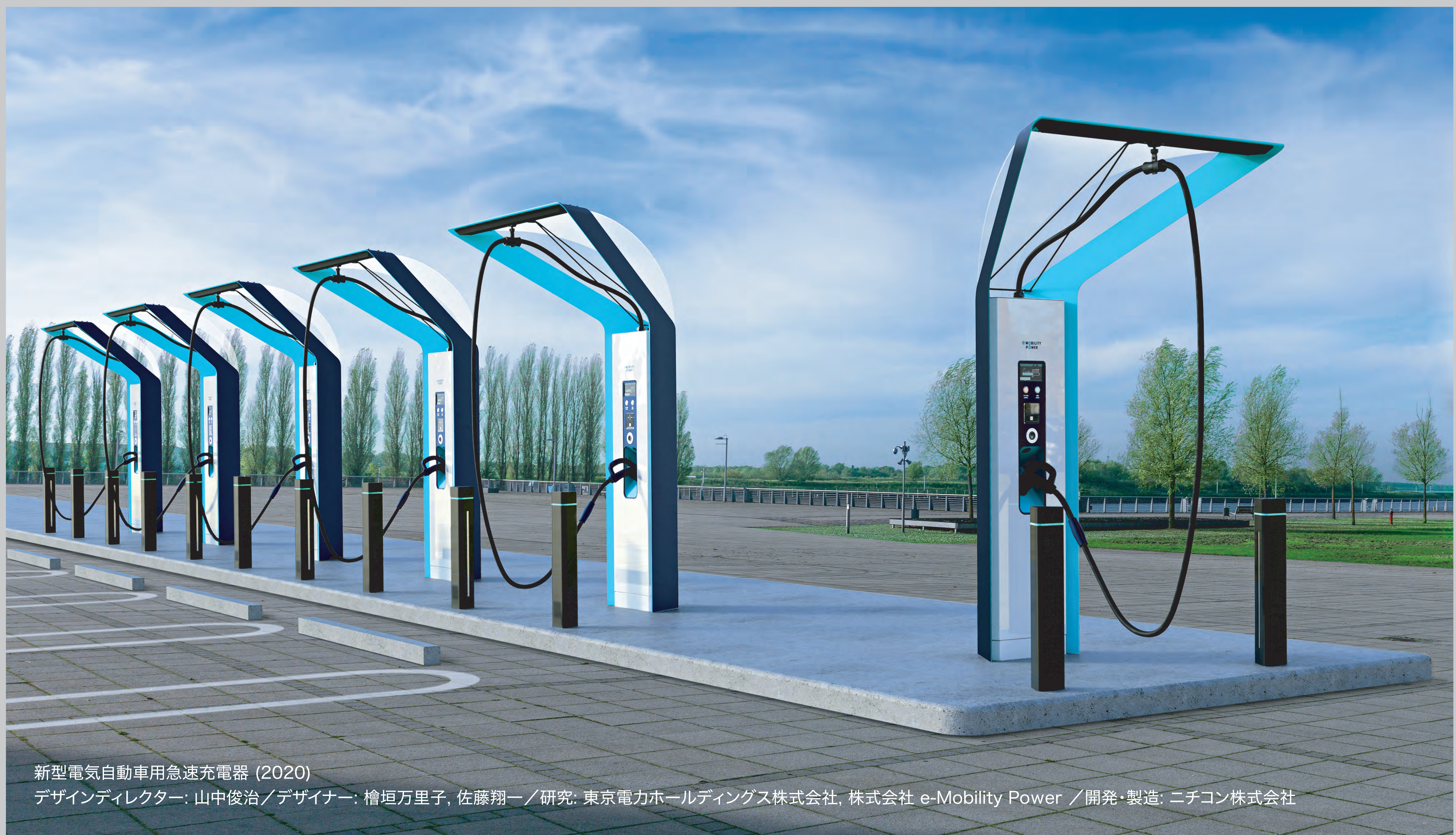
新型電気自動車用急速充電器 (2020) デザインディレクター: 山中俊治 / デザイナー: 檜垣万里子, 佐藤翔一 / 研究: 東京電力ホールディングス株式会社, 株式会社 e-Mobility Power / 開発・製造: ニチコン株式会社