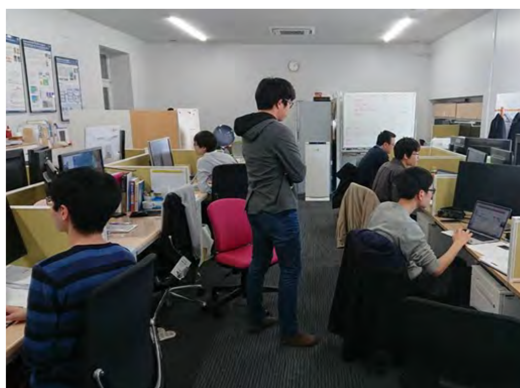
研究スペース メンバーが集中的に議論する機会があります。

東京大学柏キャンパスの、生産技術研究所大規模実験高度解析推進基盤に研究室があります。