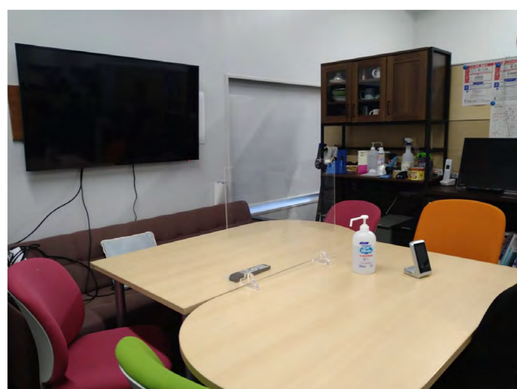
談話スペース 研究室メンバーの憩いの場所。