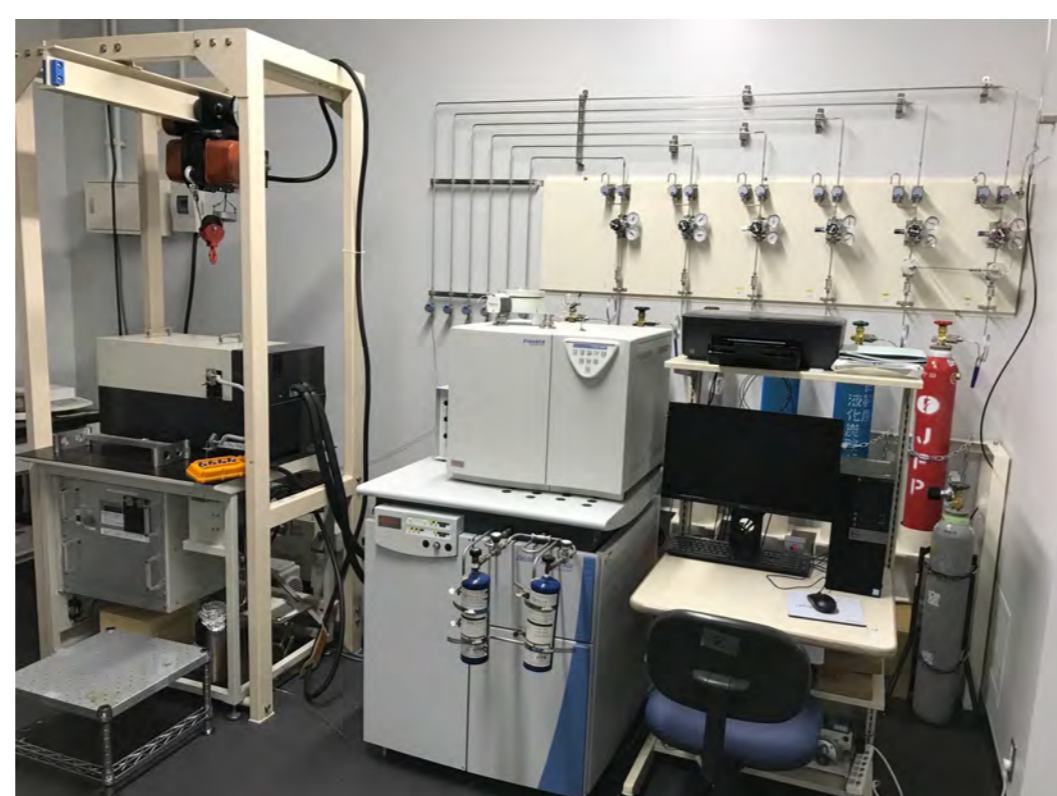
同位体実験室 質量分析計やレーザー分光計など各種実験機材も完備。