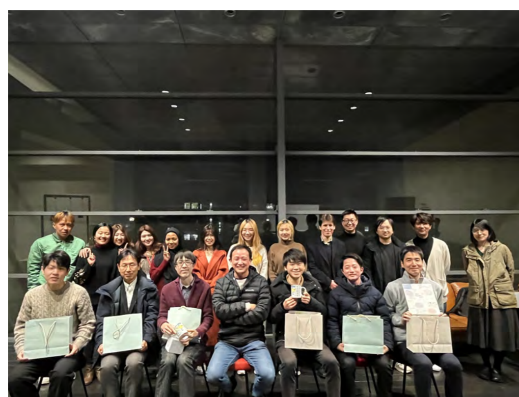
国際色豊かなメンバー 世界各国の学生が研究に関して日々活発な議論を行っています！