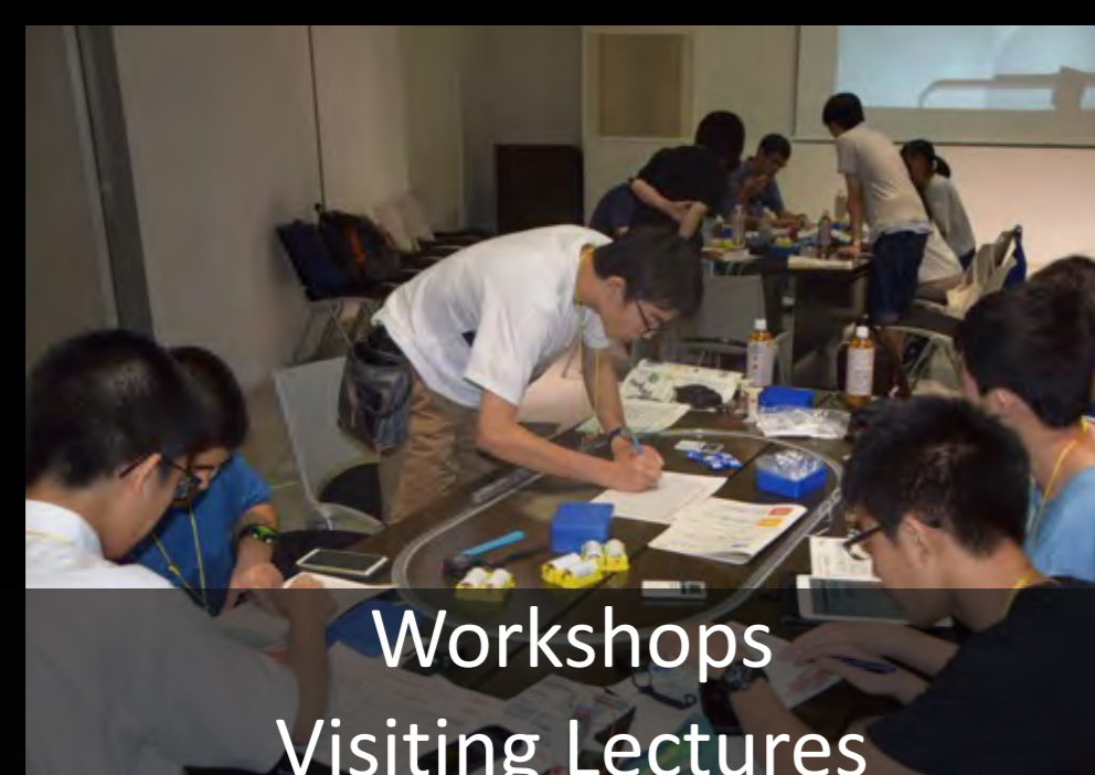
Workshops Visiting Lectures