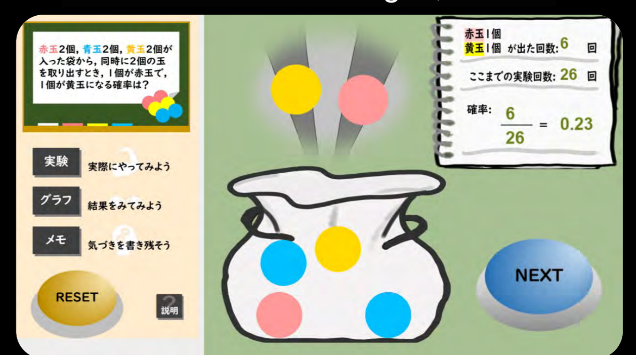
Digital Contents (Kurata and Kawagoe, 2022)

Development of teaching materials and worksheet