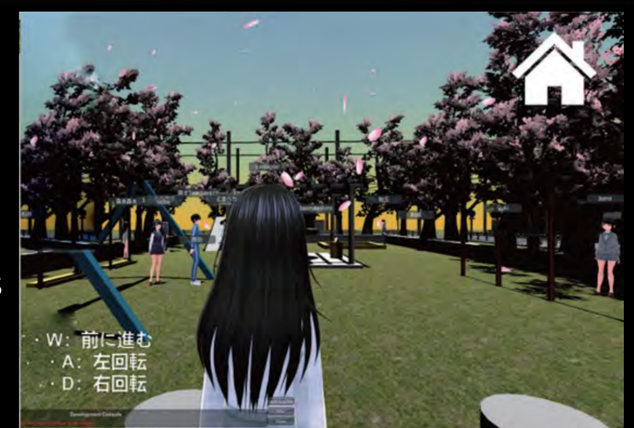
VR Contents (Yasukawa and Kawagoe, 2021)

Development of Digital teaching materials (VR, YouTube, DVD)