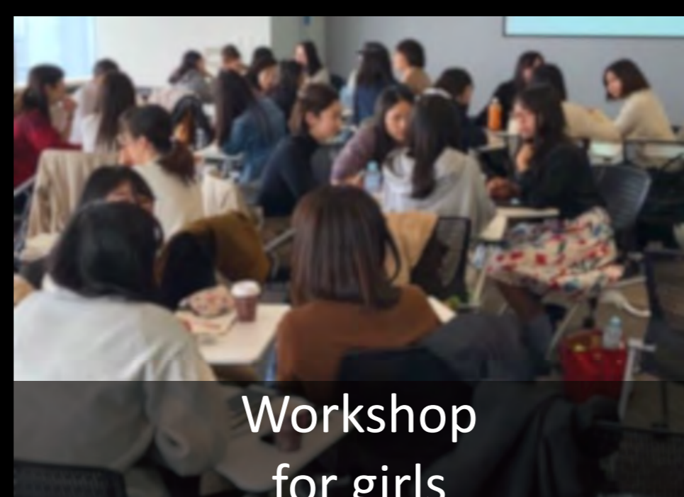
Workshop for girls